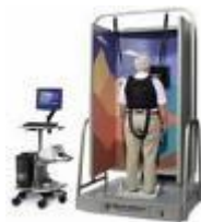
Illustratie 2. Het evenwichtsplatform

Heb je zin om deel te nemen of wil je meer informatie over dit onderzoek?